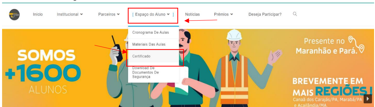
Figura 2: Espaço do Aluno

2.2. Após acessar a tela inicial, vá até a opção Espaço do Aluno e em seguida clique em Certificado , conforme imagem abaixo: