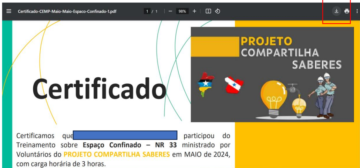
Figura 7: Baixar Certificado

2.7. Após abrir o certificado clique em baixar, conforme imagem abaixo: