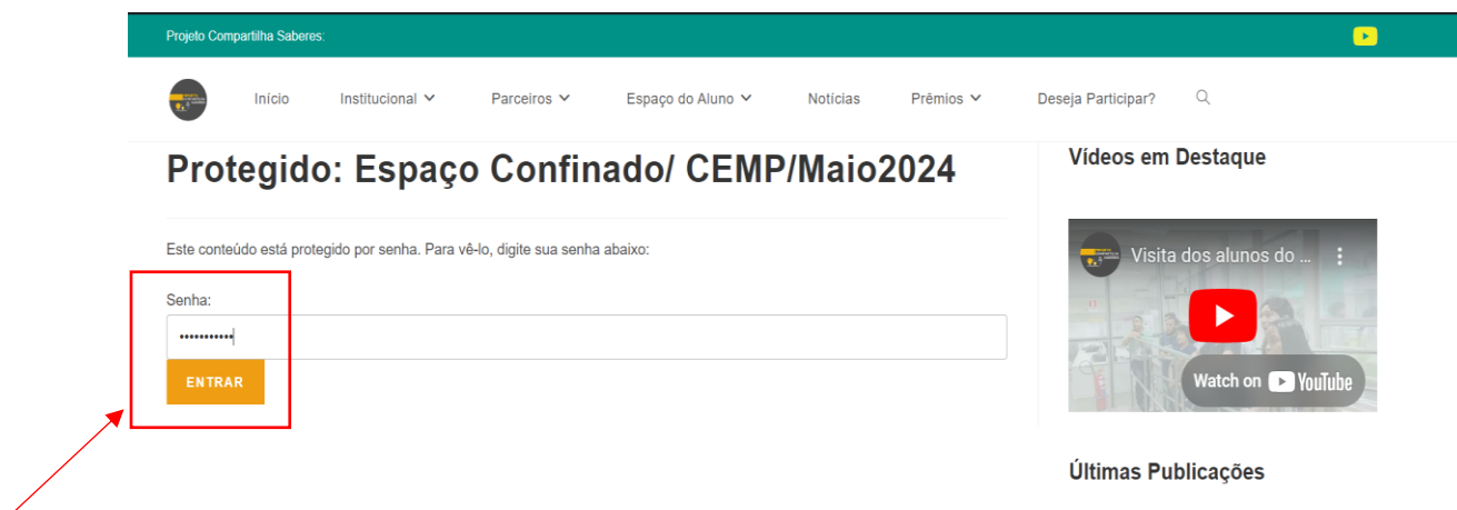
Figura 5: Senha da turma

2.5. Após escolher a turma você terá que pôr a *senha da turma para acessar seu certificado, conforme imagem abaixo: