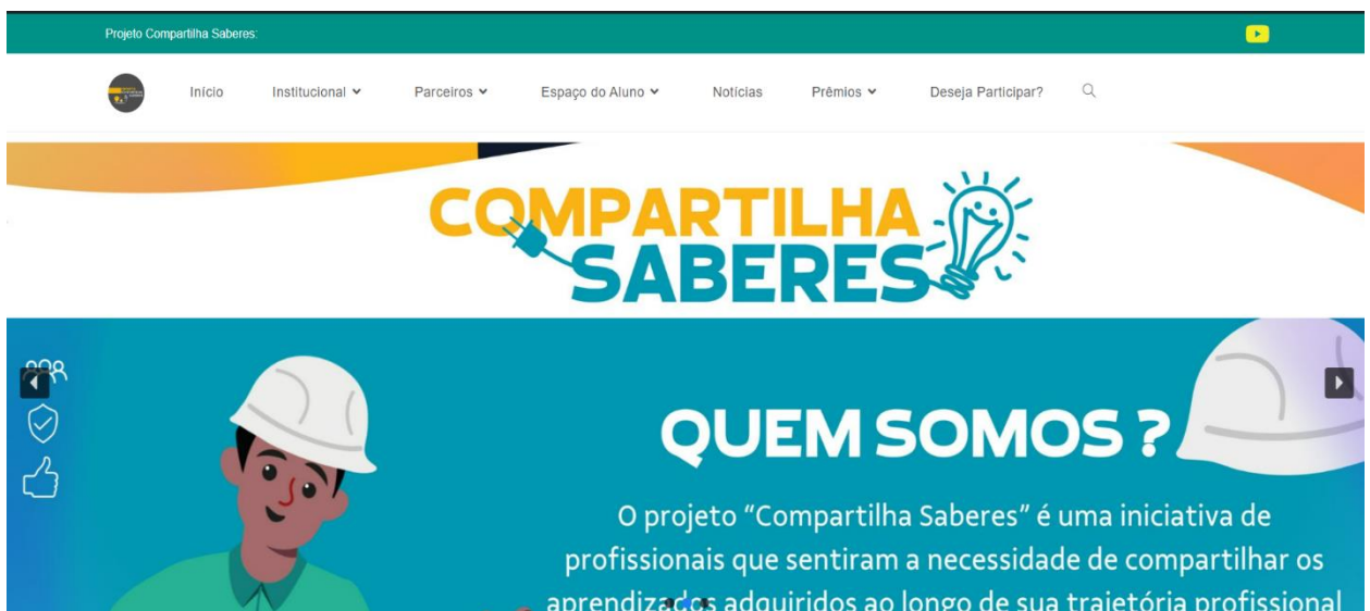
Figura 1: Tela Inicial

2.2. Após acessar a tela inicial, vá até a opção Espaço do Aluno e em seguida clique em Certificado , conforme imagem abaixo: